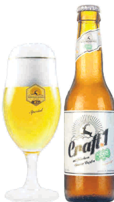
Craft 1 – ein herbes Spezialbier mit feinem Citrus-Aroma