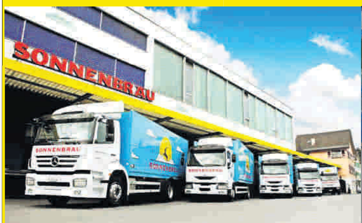
7 Lastwagen und 3 Lieferwagen verteilen das feine Sonnenbräu Bier über die Grenze des Rheintals hinaus bis nach Zürich, Aargau und Luzern.