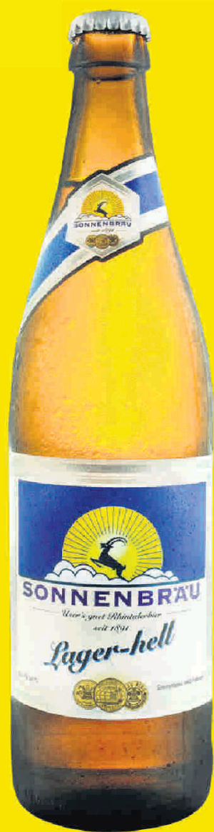
Mit einem Anteil von über 50% ist Sonnenbräu Lager hell das meistgetrunkene Bier.